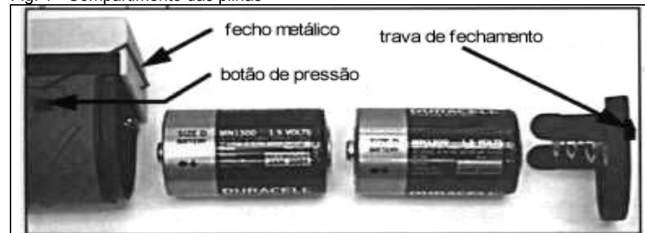
Fig. 1 - Compartimento das pilhas

Para manter a condição de "intrinsecamente seguro", o fecho metálico tem que estar firmemente colocado sobre a tampa do compartimento das pilhas. Quebra ou desgaste das abas plásticas podem reduzir a capacidade de fixação do fecho metálico, comprometendo a segurança intrínseca do instrumento.